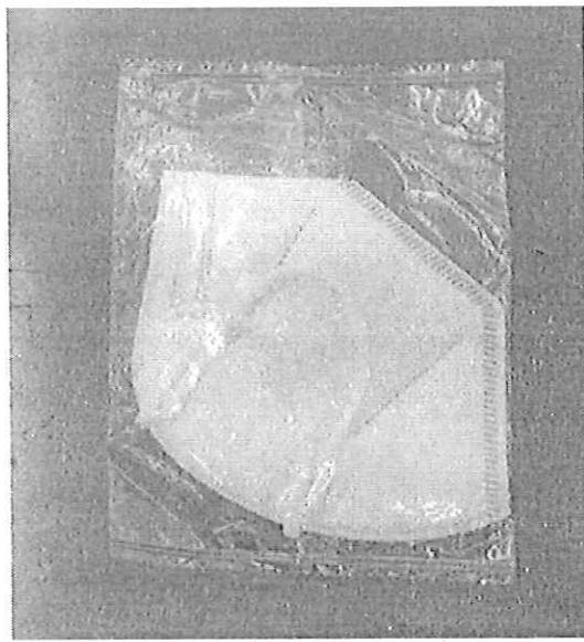
Foto 2 facciale filtrante FFP2