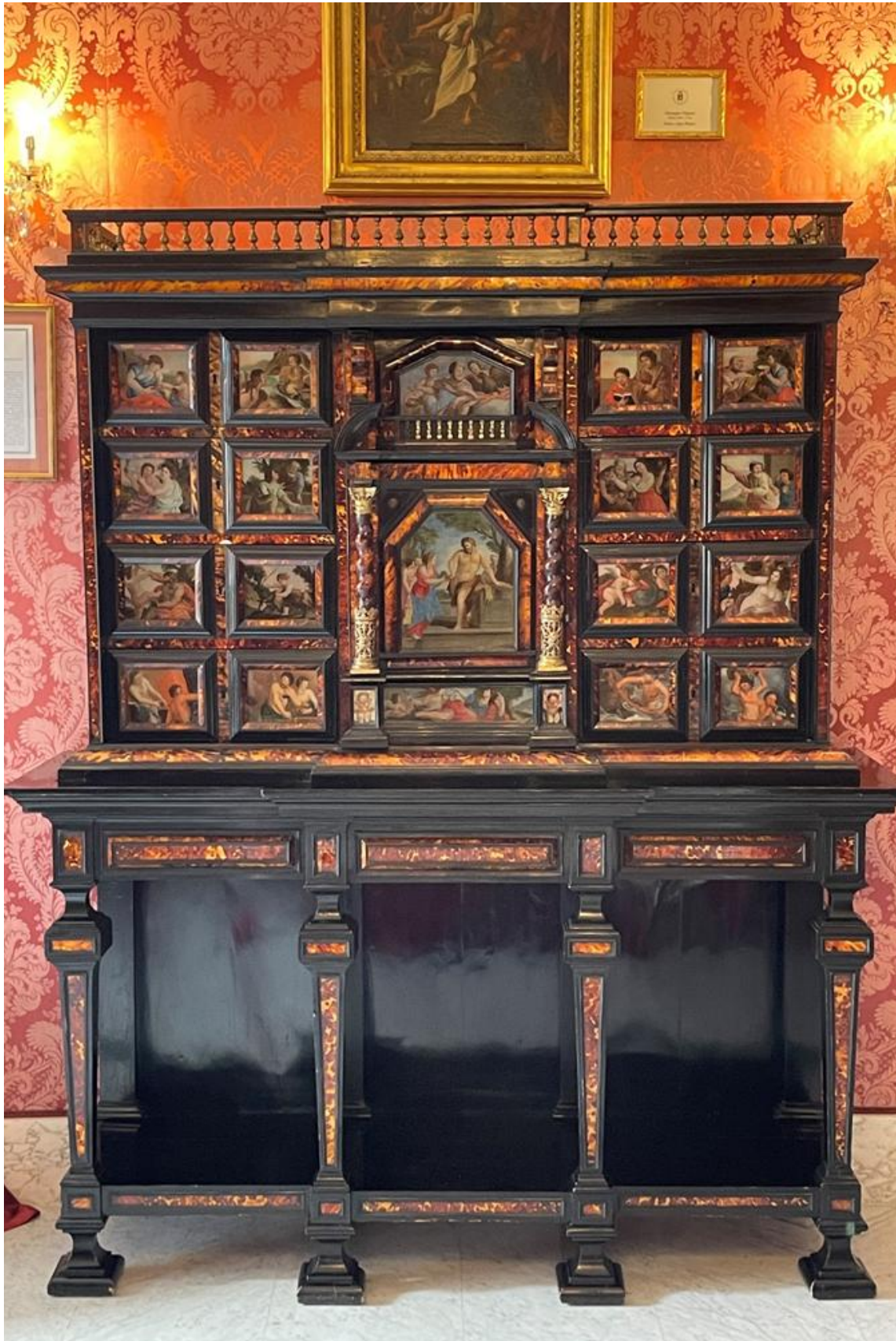
Figura 11. Stipo sala Caminetto