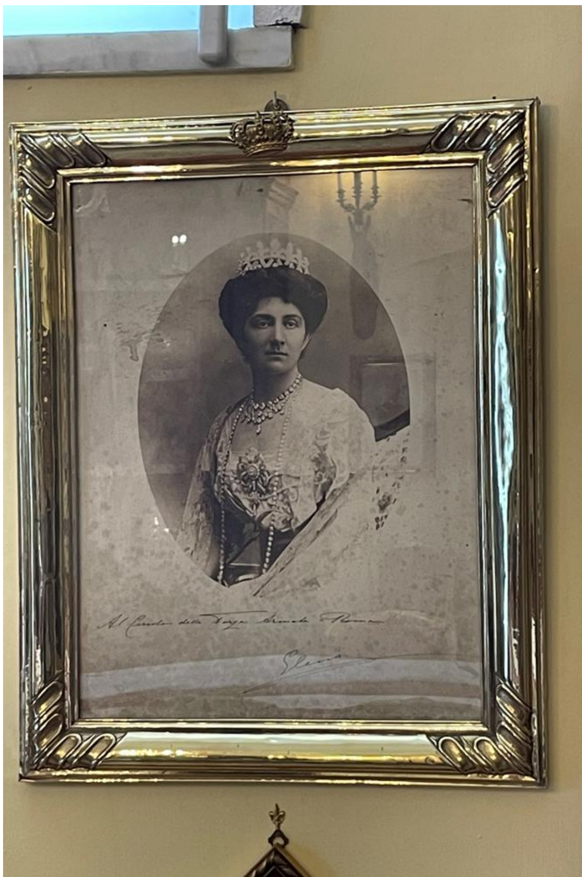
Figura 12. Regina Elena fotografia