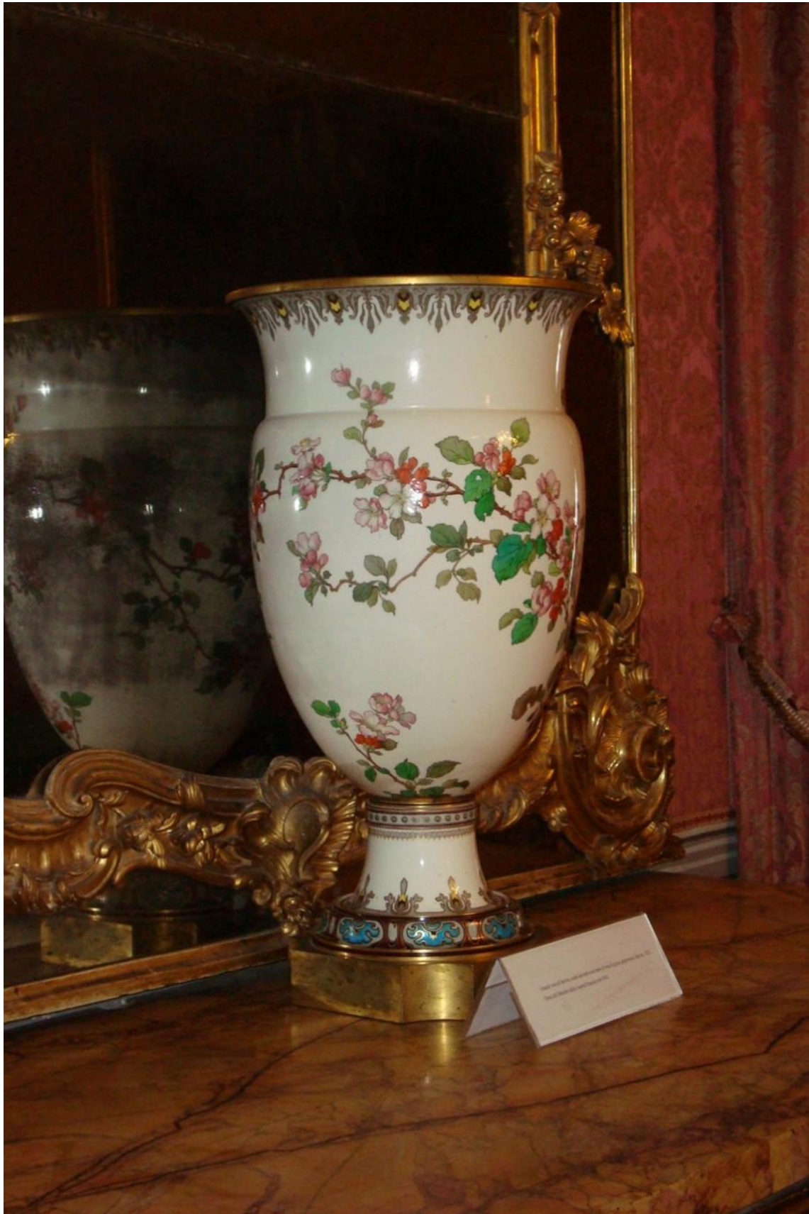
Figura 7. Vaso omaggio ministro francese della guerra