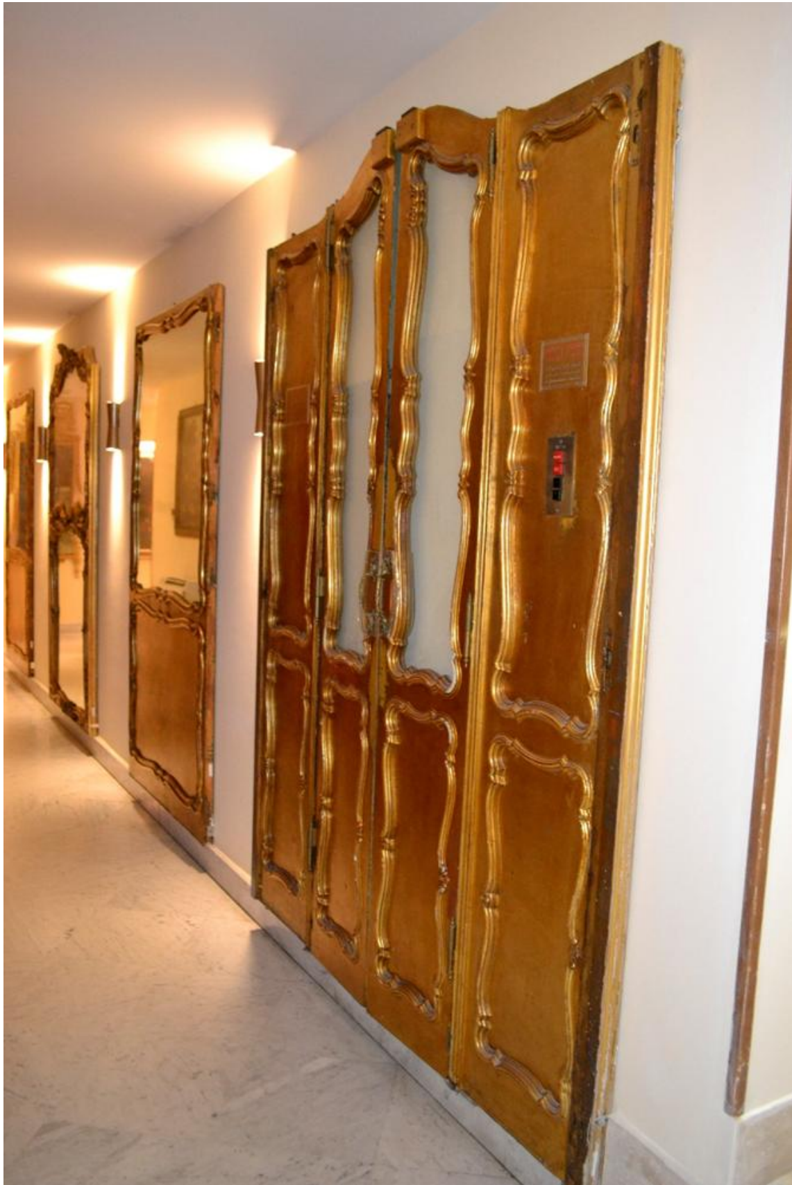
Figura 13 Porte carrozza Re