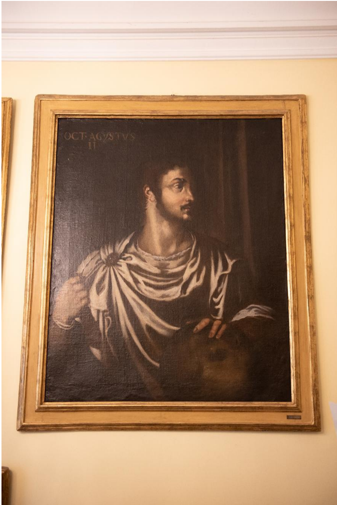
Figura 6. Imperatore Ottaviano Augusto scalinata Primo piano