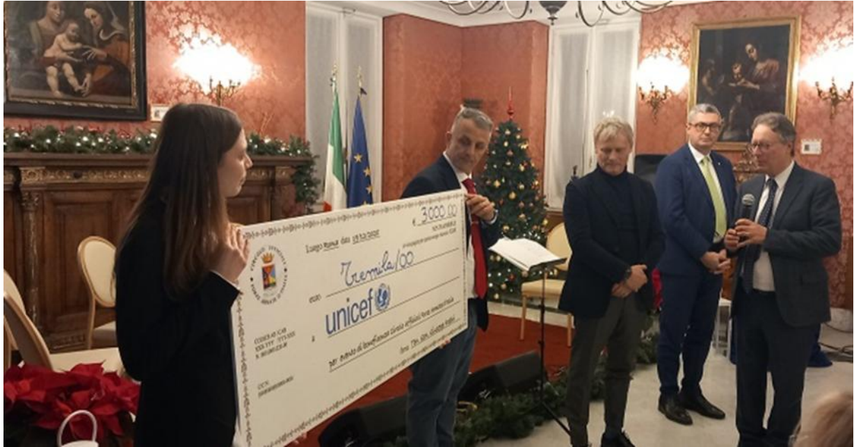
Figura 3. Consegna dell'assegno all'UNICEF