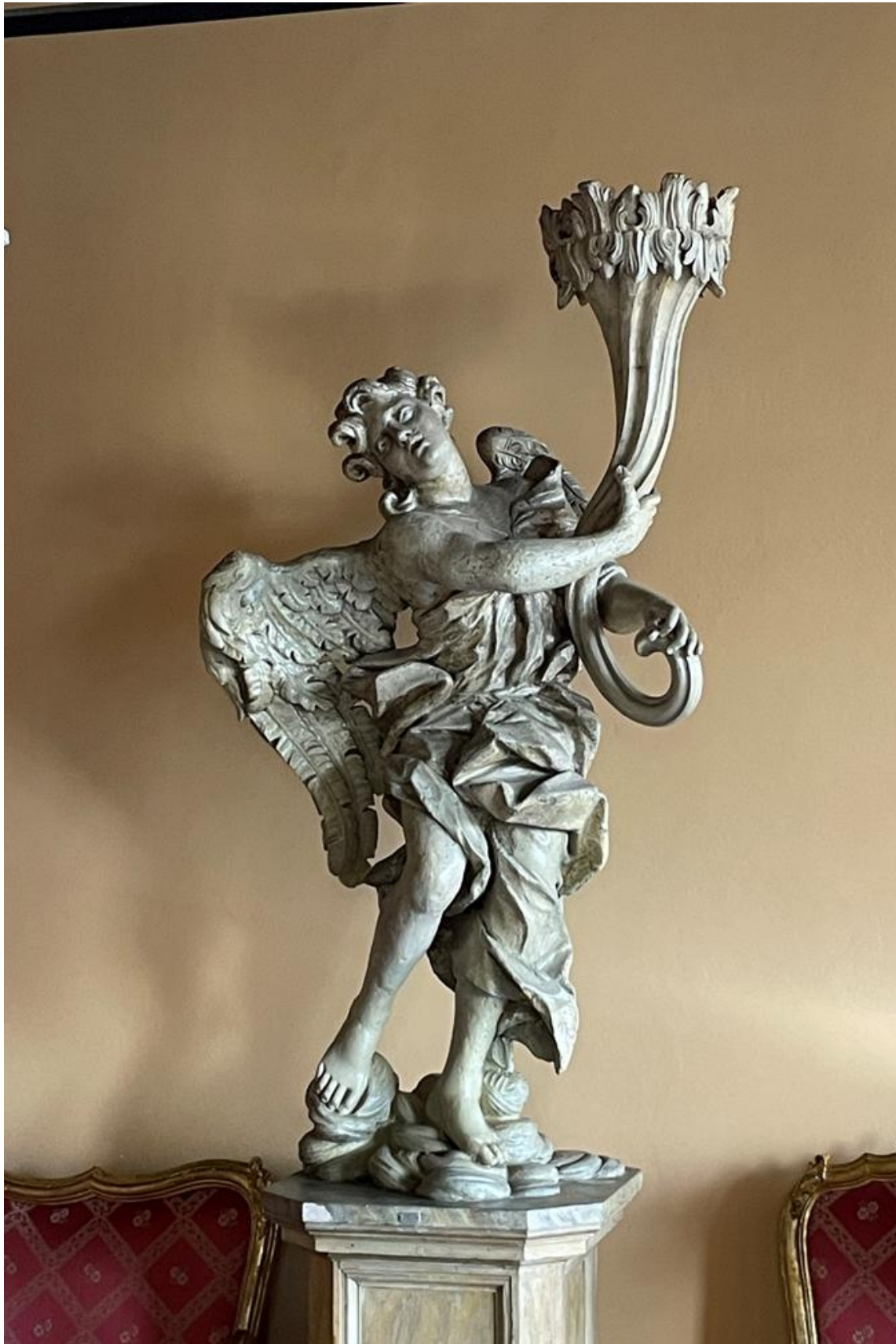
Figura 9. Altro Anegelo con cornucopia SALA CHIOSTRINO