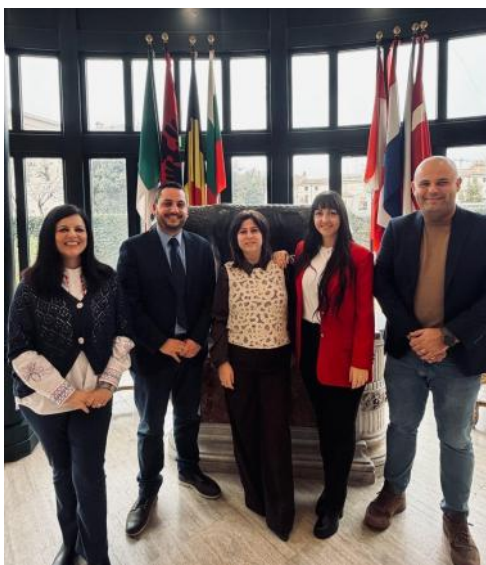
Il personale dell'Ufficio Attività Istituzionali

Raccogliamo emozioni e aneddoti direttamente dal personale dell'Ufficio Istituzionale del CUFA, nella successiva intervista.