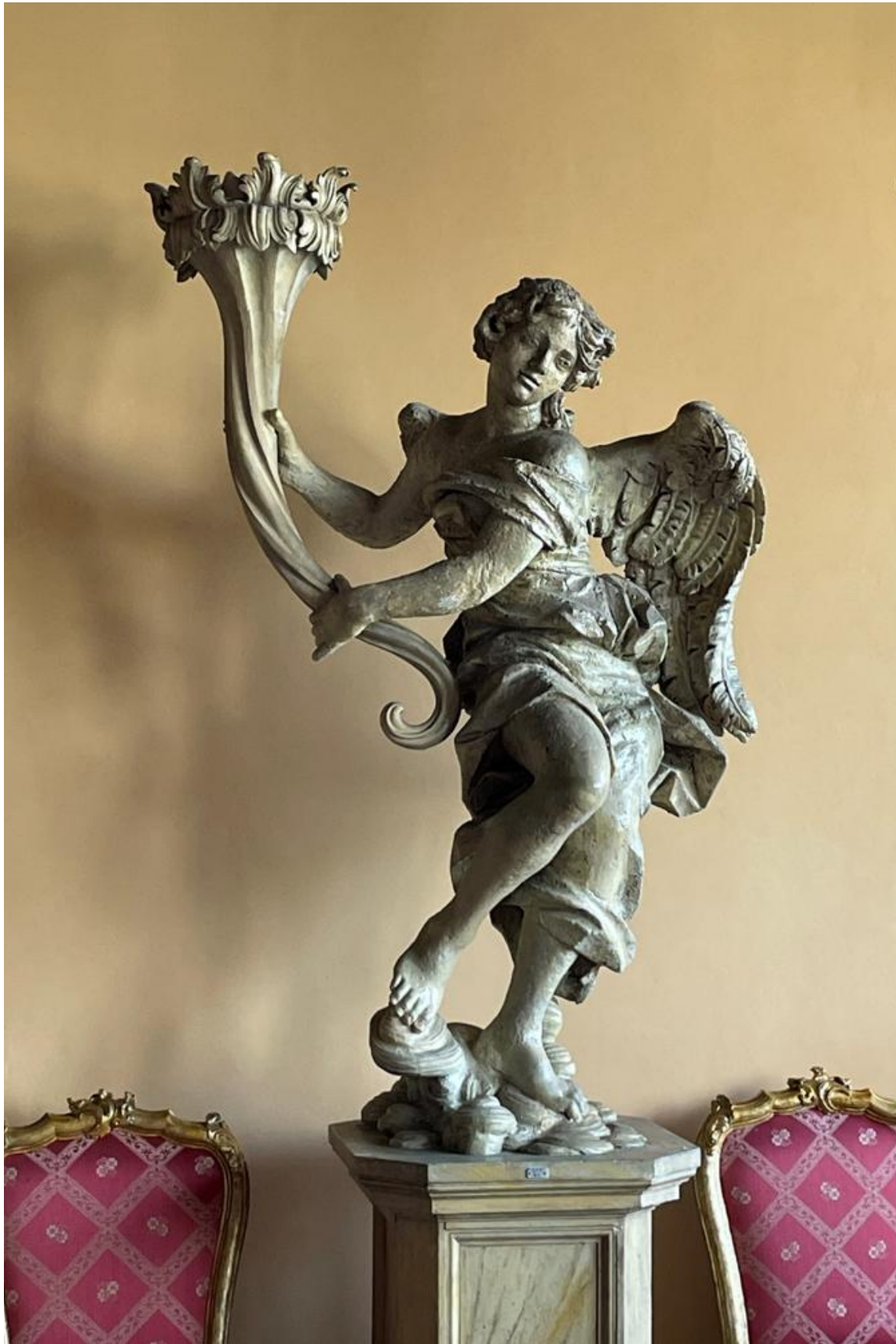
Figura 8. Angelo con cornucopia in legno sala CHIOSTRINO