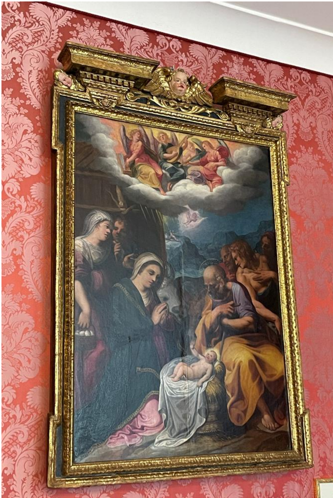
Figura 10. Adorazione del bambino olio su tela attribuito a JACOPO LIGOZZI