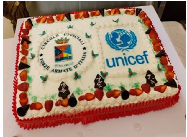
Figura 5. Torta realizzata dai pasticceri del CUFA