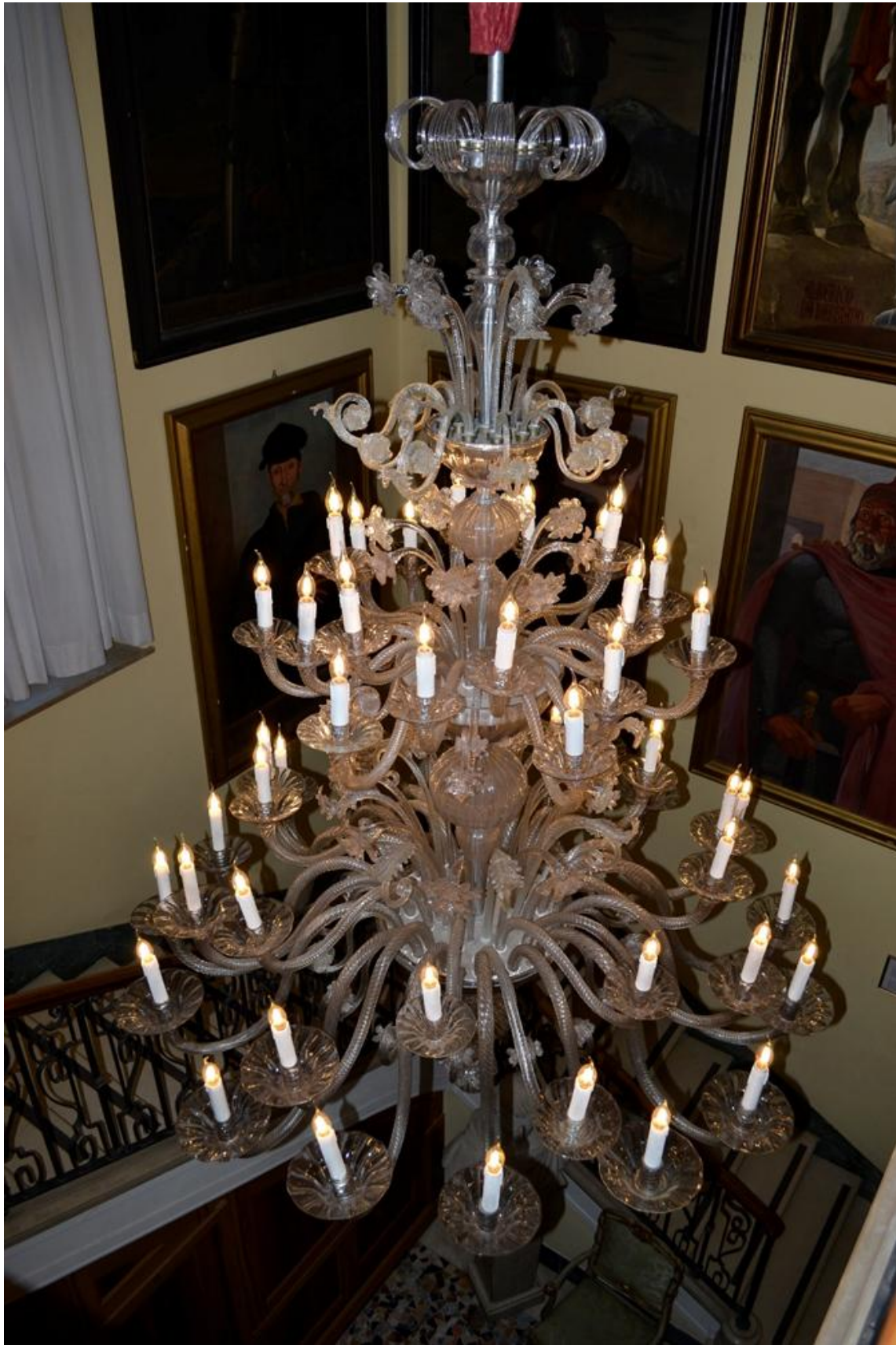
Figura 15. lampadario in vetro di murano vano scale