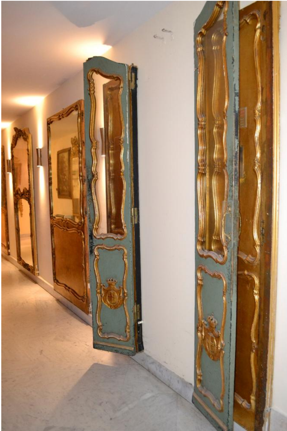
Figura 14. Porte carrozza re