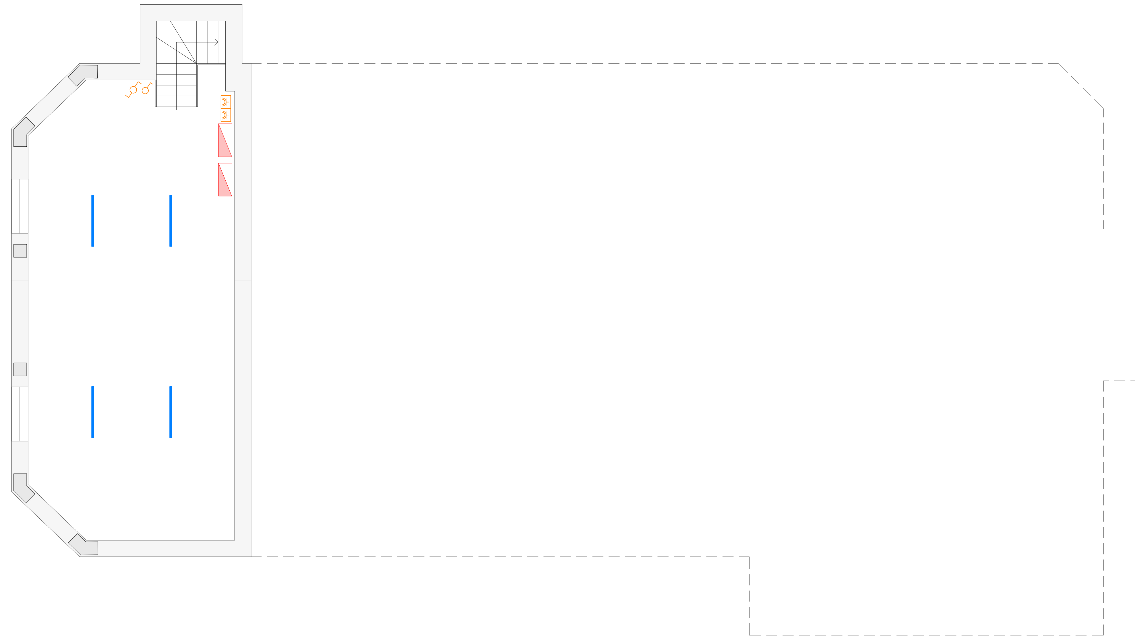
PIANTA PIANO SEMINTERRATO