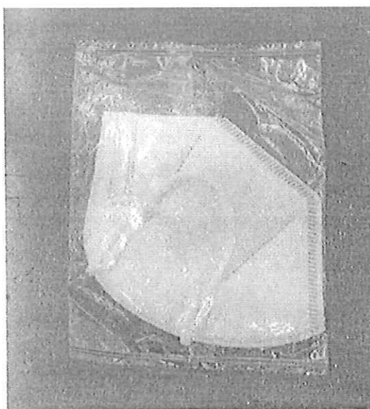
Foto 2 facciale filtrante FFP2