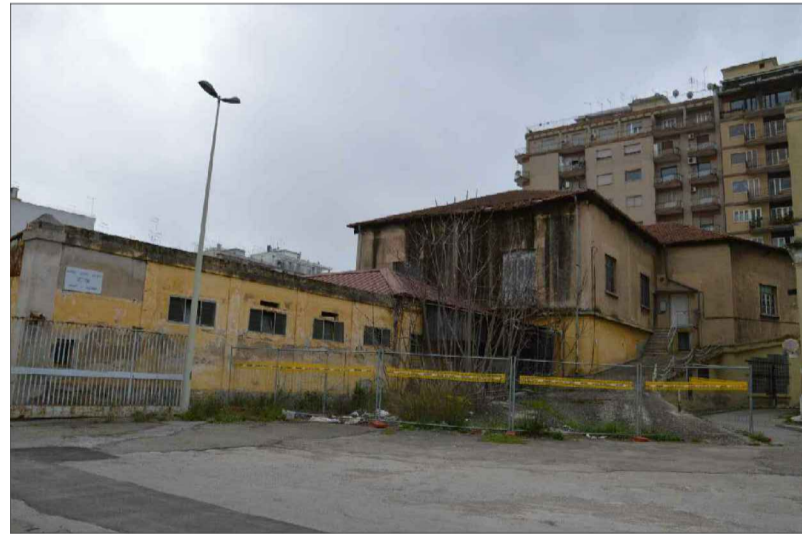
AREA ESTERNA R.M.M.L.A.