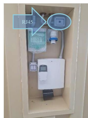
Fig. 4-5-6 immagine, a titolo puramente esemplificativo, camera IR