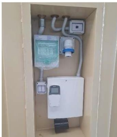
Fig. 3 immagine, a titolo puramente esemplificativo, parete di testa