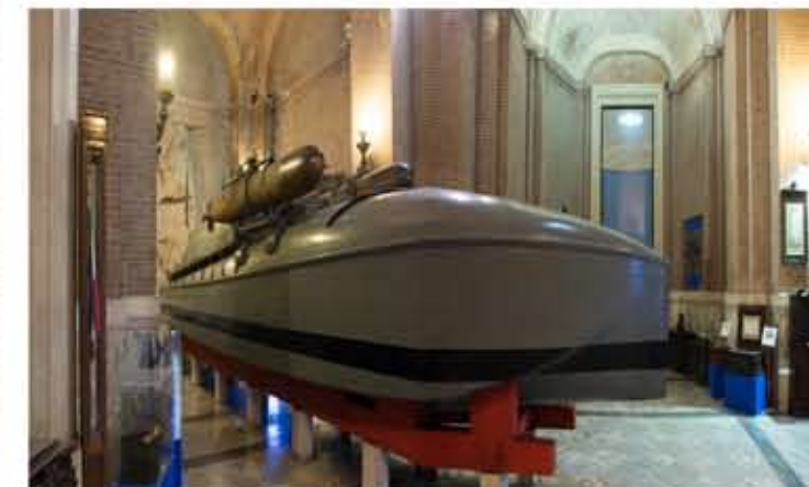
Vue générale du salon principal du Musée monument de la Marine Militaire, au centre le MAS 15