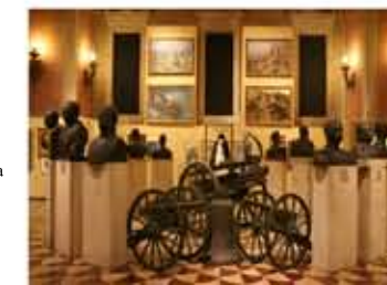
Musée central du Risorgimento, salon de la Première Guerre mondiale