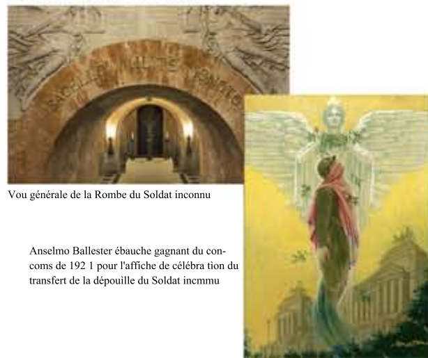
Vitrine générale de la Tombe du Soldat inconnu

La Tombe du Soldat inconnu, terminée au mois de mai 1935, est réalisée selon un plan en croix grecque sous une coupole centrale et elle est reliée à la galerie du Musée des Drapeaux à travers deux escaliers. Le sol est formé de dalles en marbre du Corso, rappelant les lieux où les Italiens ont combattu la Première Guerre mondiale, tandis que l'autel est obtenu d'un bloc unique de pierre du Monte Grappa. L'autel funéraire, encastré dans la paroi et logé dans une niche, correspond parfaitement à la stèle du Soldat Inconnu de l'extérieur et est orné de la seule inscription qui rappelle le motif de l'attribution de la médaille d'or. Sur les murs de la chapelle, un cycle mosaïque de style byzantin est l'œuvre de l'artiste toscan Giulio Bargellini : au-dessus de la partie de la tombe du Soldat Inconnu, on peut voir la scène de la Crucifixion; la coupole est couverte de mosaïque représentant les saints protecteurs des différents corps d'armée : la vierge de Lorette pour l'Aéronautique, Saint Martin pour l'Infanterie; Saint Georges pour la Cavalerie, Saint Sébastien pour les Milices et Sainte Barbara.