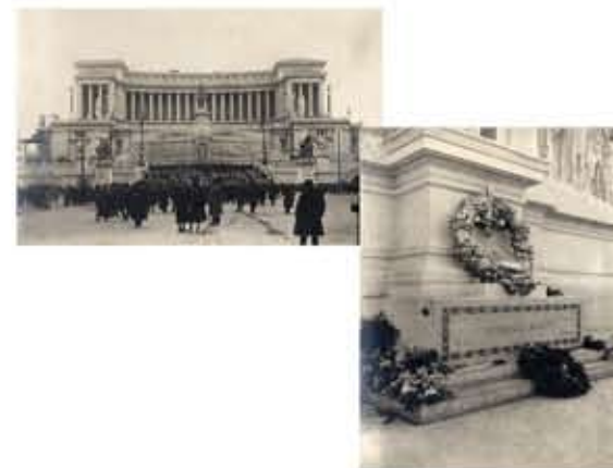
Cérémonie du Soldat inconnu, 28 octobre - 4 novembre 1921 Photographies tirées de l'album "Honneurs au Soldat inconnu 28 octobre - 4 novembre 1921" MCRR, ms 998