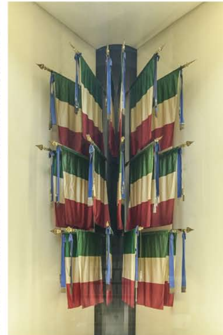
Musée des Drapeaux des Forces Armées, Drapeaux de Guerre