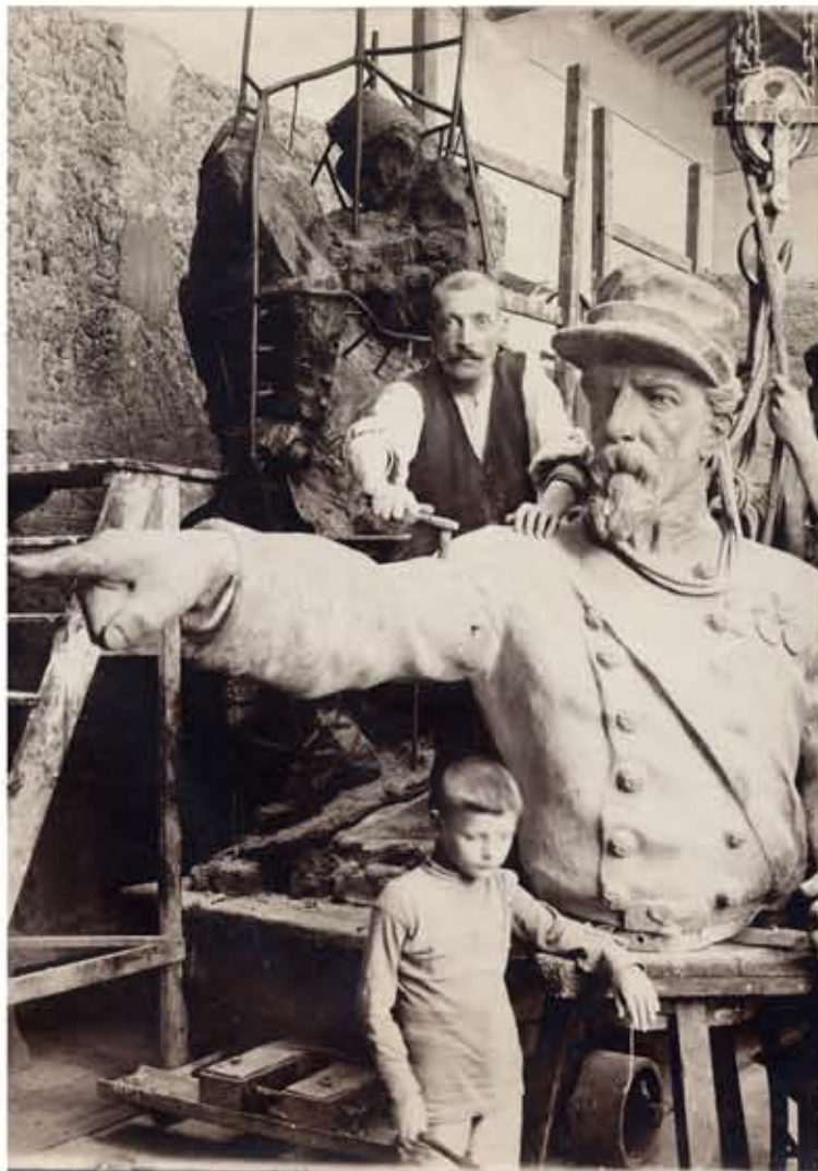
Une des phases de réalisation de la statue du général Cialdini (détail) 1911-1912