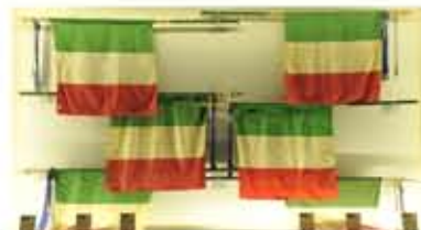
Musée des Drapeaux des Forces armées, Drapeaux de Guerre.

et pavillons utilisés par les bâtiments royaux (Regie Navi) du Royaume de Savoie.