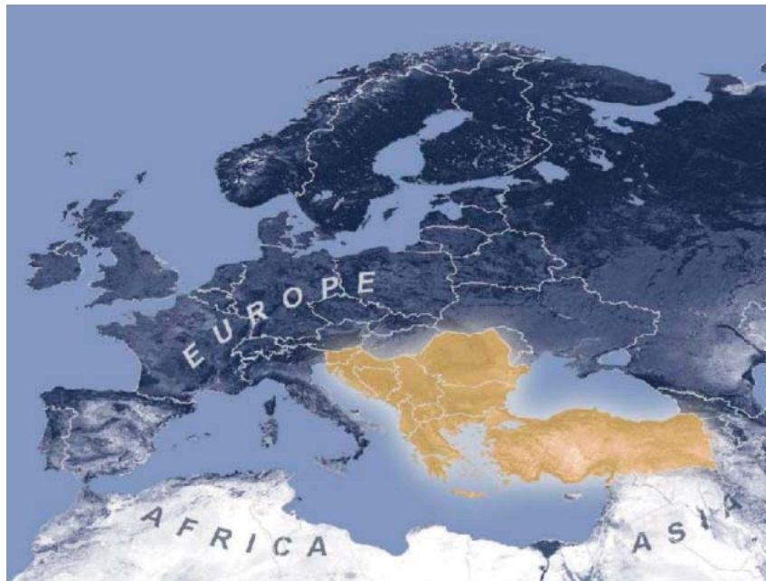
concetto geopolitico dell'Europa Sud Orientale