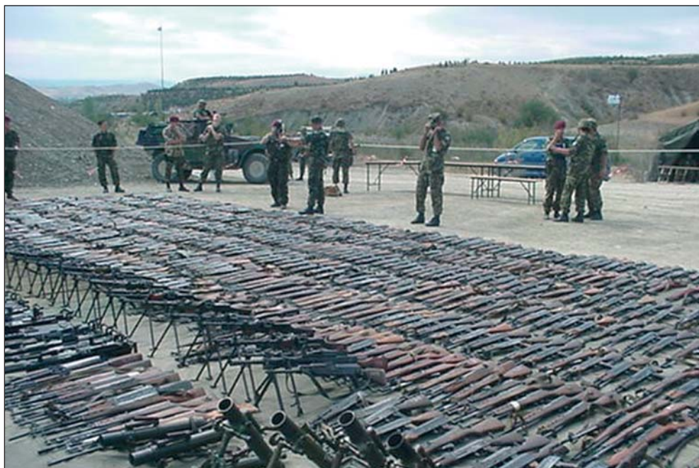
Sequestro di armi nei Balcani

Le missioni "non art. 5", dovevano essere valutate e decise caso per caso secondo una gamma di interventi, che vanno dalla prevenzione alle operazioni di risposta alle crisi ( peace making, peace keeping, peace building ), sino all'imposizione della pace.