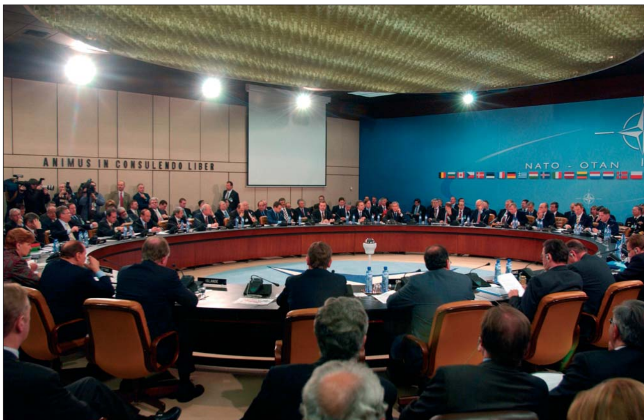
Sessione di un summit della NATO

Allo scopo di accelerare il processo di adesione allo NATO, l'Albania, la Macedonia e la Croazia, hanno firmato un accordo ( Adriatic Chart ) con gli USA, con la promessa di essere ammessi all'Alleanza entro il 2007. La Bosnia e