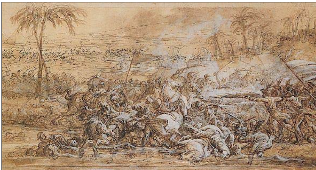
Battaglia delle Piramidi

Una flottiglia d'avvisi, sciabecchi, bombarde,