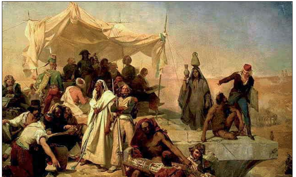
Scoperta dell'antico Egitto 1798

L'offensiva contro la città fu sferrata contemporaneamente da tre divisioni. Quella comandata dal generale Menou marciò lungo il litorale e prese il castello triangolare situato presso il porto vecchio. Marmont, con una parte della divisione Bon, attaccò la porta di Rosetta per dove entrò dopo averla abbattuta a colpi d'ascia. Infine, la divisione comandata dal generale Kleber sferrò l'assalto generale. Questa travolse ogni difesa e che si fermò quasi sotto la colonna di Pompeo. I pochi giannizzeri di differenti nazioni, isolati e senza ordini, furono respinti nelle strade della città. Qui la popolazione rinchiusa nelle case, sparava sui soldati francesi attraverso le inferriate delle loro finestre, causando gravi perdite. Infine, le truppe turche furono costrette a ritirarsi nel forte del Faro, ai bordi del mare, dove trovatesi ben presto a corto di munizioni furono costrette ad arrendersi. Nel frattempo, il resto dell'armata – le divisioni Reynier e Desaix – aveva terminato le operazioni di sbarco.