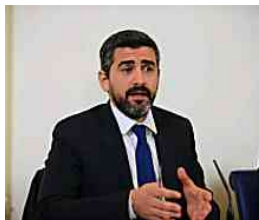
Ong e Libia, cosa hanno scoperto i Servizi segreti di Germania, Italia e Oland...