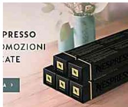
Accedi e scopri le offerte Nespresso per te Nespresso