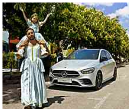
Nuova Classe B. Da 220€/mese solo con MB... Mercedes-Benz