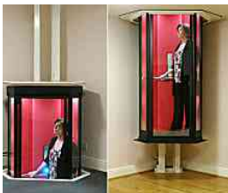
Scale di risalita: quanto sono costosi? Cerca ora Offerte di Montascale | Link Sponsorizzati