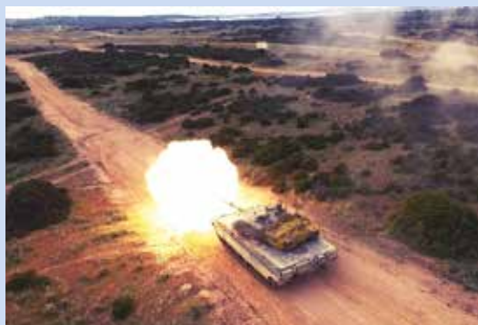
Tattico di 1° livello di Capo Teulada. Capo Teulada, 3 Aprile